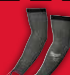
ARM-SCHNITT- SCHUTZ KLASSE E