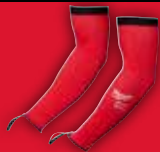
ARM-SCHNITT- SCHUTZ KLASSE C